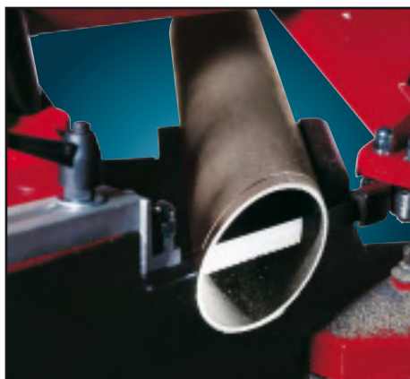
Angolo di taglio regolabile da 0° a 45° sinistra. Angle de coupe réglable de 0° à 45° gauche.