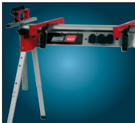
Banco pieghevole "Multy" (art. 360 a richiesta) Etabli pliable "Multy" (art. 360 sur demande)